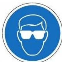
Lunettes de protection