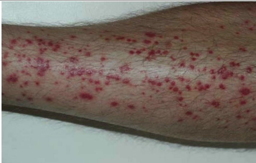
Purpura sur le mollet d'un jardinier paysagiste.

Les plantes du genre Agave sont bien adaptées aux conditions sèches et sont exploitées pour la production de fibres ou d'alcool comme la tequila. Elles sont aussi utilisées comme plantes d'ornement dans les jardins où elles peuvent se révéler envahissantes.